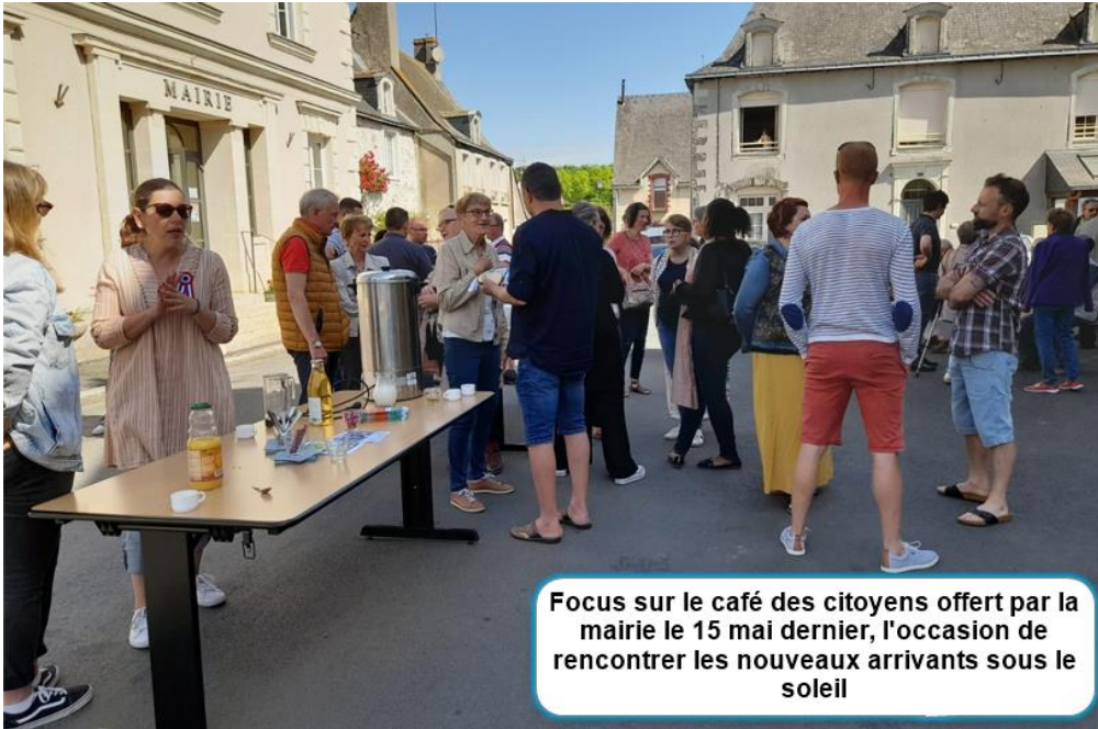
Focus sur le café des citoyens offert par la mairie le 15 mai dernier, l'occasion de rencontrer les nouveaux arrivants sous le soleil