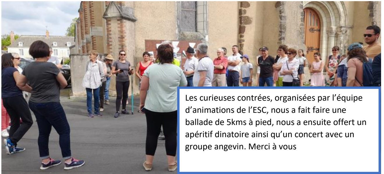
Les curieuses contrées, organisées par l'équipe d'animations de l'ESC, nous a fait faire une ballade de 5kms à pied, nous a ensuite offert un apéritif dinatoire ainsi qu'un concert avec un groupe angevin. Merci à vous